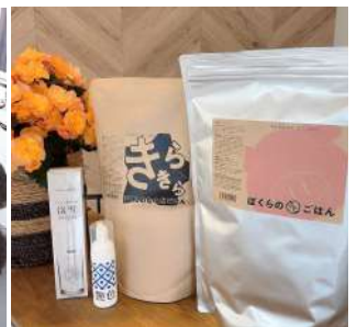
▲栄養満点ドッグフード販売中