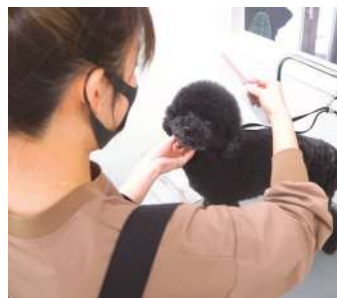
▲まるくてカワイイ姿に変身

ワンちゃんが健康的な生活を送るための栄養満点ドッグフードも販売していますので、皆様のご来店をお待ちしております。