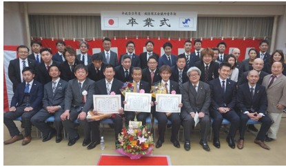
▲現役メンバーが卒業生を囲み、集合写真