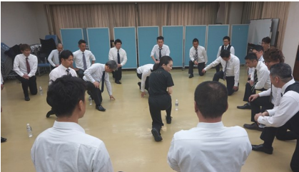
▲RIZAP式トレーニング方法を学ぶメンバー

3月17日(日)当所にて33名参加のもと、研修事業「RIZAP健康セミナー」を開催。講師を招き、有効な食事指導やトレーニング方法について学びました。