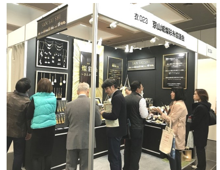
▲積極的に商談を行うメンバー