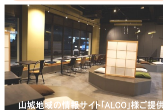
山城地域の情報サイト「ALGO」様ご提供